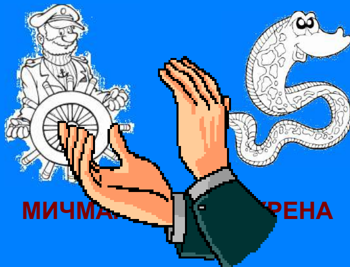
МИЧМАК ЗМЕЯ МЕДУЗА